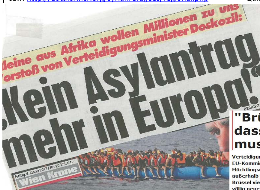
Ankünfte Bootsflüchtlinge in ITALIEN 2016

bzw. http://data.unhcr.org/syrianrefugees/regional.php Qu.: https://data2.unhcr.org/en/situations