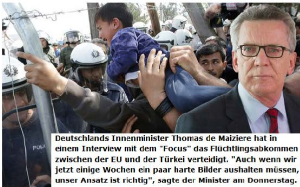
Deutschlands Innenminister Thomas de Maiziere hat in einem Interview mit dem "Focus" das Flüchtlingsabkommen zwischen der EU und der Türkei verteidigt. "Auch wenn wir jetzt einige Wochen ein paar harte Bilder aushalten müssen, unser Ansatz ist richtig", sagte der Minister am Donnerstag.