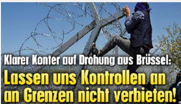
Flüchtlinge in der Mindestsicherung

https://de.wikipedia.org/wiki/Fl%C3%BChtlingskrise_in_Europa_ab_2015