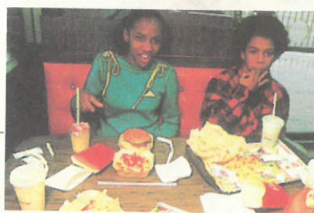
汉堡包 美国人喜欢吃汉堡包。