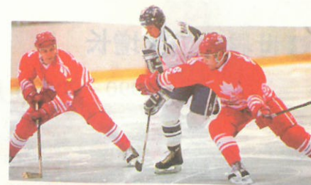
④ 加拿大的冬季漫长，适宜人们开展各种冰上运动。