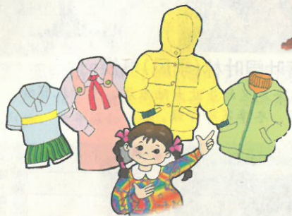
③ 生活在温带地区的人们，穿衣服的多少随季节而变化。