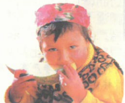
① 哈密瓜适宜生长在干旱少雨的温带地区。