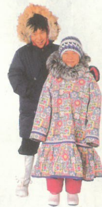
⑤ 生活在寒带地区的人们，一年四季都要穿厚厚的衣服。