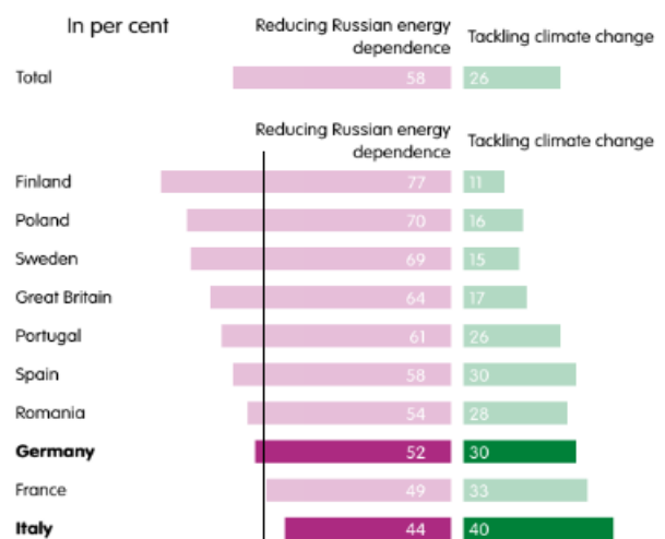
What should be more important for the EU: reducing energy dependence on Russia, or sticking to climate policy goals?

>> https://ecfr.eu/wp-content/uploads/2022/06/peace-versus-justice-the-coming-european-split-over-the-war-in-ukraine.pdf >> „In many European countries, Ukraine’s cause could change from being a unifying national endeavour and turn into a divisive political issue. But, as well as causing tensions within individual countries, the war could mean that the political stances of states such as Poland and Italy increasingly diverge ... The key to maintaining European unity in support of Ukraine is to take the fears of escalation seriously and to present the conflict as a defensive struggle against Russian aggression rather than talking about Ukrainian victory and defeating Russia.... Perhaps the most worrying sign is that most Europeans see the EU as a major loser in the war, rather than reading its relative unity as a sign of a strengthening union.... The next few weeks will be critical and the data show that it should be possible to keep Europe together with the right political messaging.