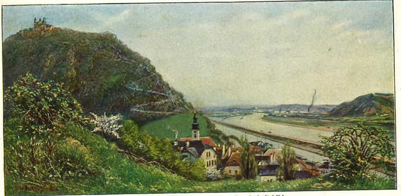
Der Donaudurchbruch bei Wien als Landschaftsbild. Talpaß zwischen dem Leopolds- und dem Bisamberge, regulierte Flußufer, Überschwemmungsgebiet. Flußhafen bei Kahlenbergerdorf, Donauauen bei Langenzersdorf, Weingärten am Bisamberge, Tieflandbucht bei Korneuburg.