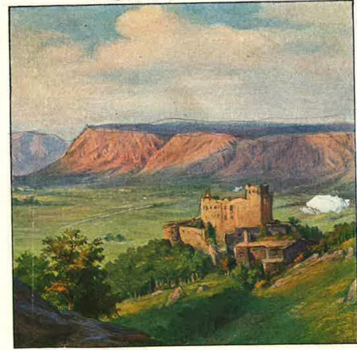
Die Hohe Wand. (Kalkplateau), mit der Neuen Welt und der Ruine Emmerberg.